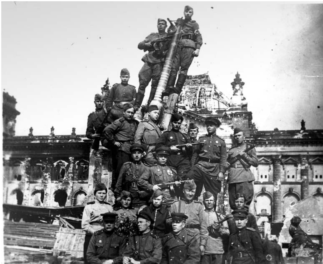
Советские солдаты на фоне развалин Рейхстага. г. Берлин, 1945 г. (ТКМ 996 НВФ)

Бесспорно, к фонду редких фотографий относятся снимки военного времени из личных архивов участников Великой Отечественной войны – это около ста фотографий, на которых