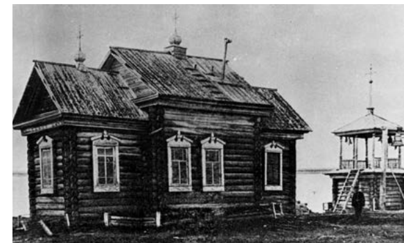
Деревянная часовня с колокольней. с. Дудинка, 1913 г.

Позднее появился кабинетный портрет – фотография размером 14х9 см. Люди, по их желанию, фотографировались на каком-нибудь иллюзорном фоне, например, с изображением дворца, колонн, тяжелого занавеса и пр. Как и у визитных фотографий, снимки закреплялись на плотном паспарту; их принято было помещать в рамки и ставить на столы или этажерки. Кабинетные портреты нашей коллекции представлены в семейных архивах Сотниковых, Тычинских, Уксусниковых.