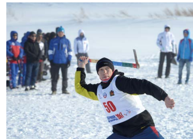
Чемпионат и Первенство России по северному многоборью. Метание топорика на дальность. г. Дудинка, 2017 г.