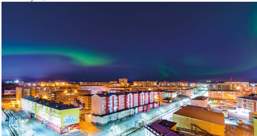
Северное сияние над Дудинкой. 2017 г.