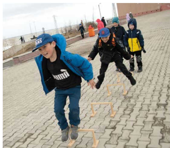
Прыжки через нарты на городской площади. г. Дудинка, 1 июня 2023 г.