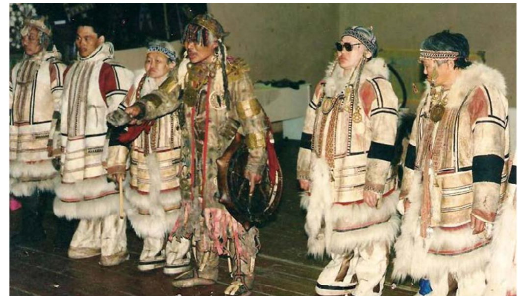
Фольклорно-этнографический нганасанский коллектив «Нгамтусуо». п. Усть-Авам, 1990-е гг.

Шаманские обряды нганасан в прошлом имели определенные календарные сроки. Трижды в году нганасанский шаман «шел» к божествам с просьбой об обильном промысле: весной, во время освобождения реки ото льда и прилёта гусей, он просил, чтобы рыба шла в сети,