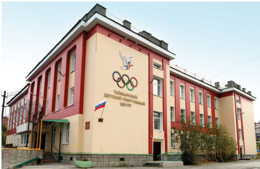
Детско-юношеская спортивная школа им. А.Г. Кизима. г. Дудинка, 2023 г.

Каждый год в городе Дудинке проводятся соревнования на личное первенство ДЮСШ им. А.Г. Кизима по северному многоборью в отдельных видах спорта, где спортсмены достигают новых высот.