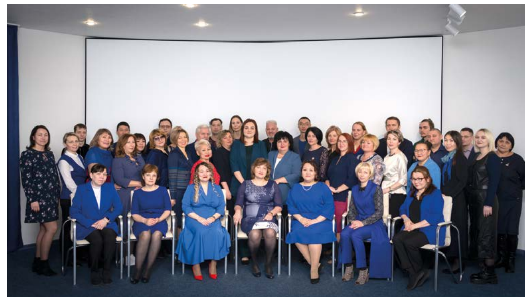
Коллектив Таймырского краеведческого музея. 2022 г.

В планах у сотрудников Таймырского краеведческого музея – продолжить устанавливать контакты с ведущими музеями, сотрудничать по разным направлениям музейной деятельности. И, конечно, удивлять, радовать, заинтересовывать посетителей выставками, мероприятиями и... культурными новинками.