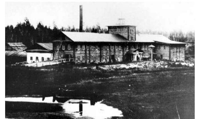
Ивановский сахарный завод на рубеже XIX–XX вв. (ШМЗ)

В результате завод понес большие убытки, а урожай остался под снегом. Причинами этому указывается низкая оплата труда, а также обман со стороны администрации при выплате денег за проделанную работу. В газете писали: «...среди населения Гусевские дела пользуются дурной репутацией, и до самого последнего времени заводская администрация не только ничего не сделала, чтобы это убеждение рассеять, а напротив, своим поведением