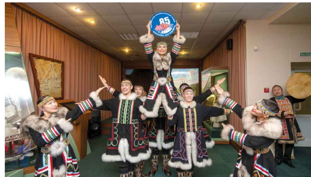
Торжественное мероприятие в честь 85-летия Таймырского краеведческого музея. 2022 г.

В рамках юбилейных мероприятий в музее было организовано и проведено сразу несколько значимых культурных событий. На площадке Таймырского краеведческого музея впервые