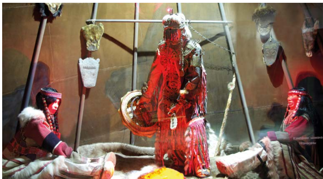
Диорама «Камлание шамана» в Таймырском краеведческом музее. г. Дудинка, 2011 г. Автор Д.С. Гаськов.

В чуме темень, посередине – жаркий огонь костра. Отсветы от костра падают на шамана, на его грозное колдовское одеяние, на группу неподвижно сидящих людей. В центре – шаман, рядом – туоптуси: помощники шамана (чаще всего родственники). Чтобы задобрить духа огня следует его покормить дымом от сгоравшего на огне жира. С «кормления костра» и начинается обряд камлания. Именно туоптуси начинает петь первым песни шамана. Он вызывает его